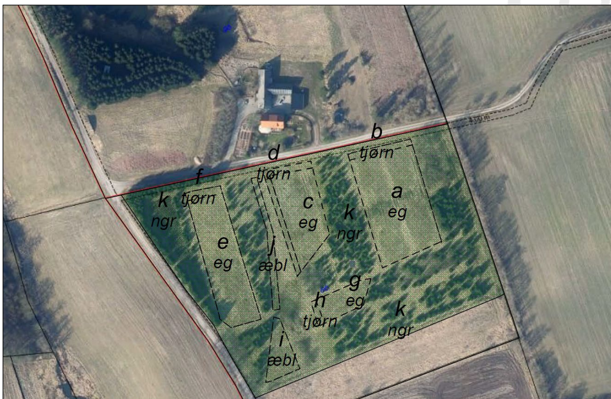
Skovkort, modtaget af ansøger den 09.11.2022.

I ønsker at etablere arealet som en blanding af eg, og æble og tjørn.